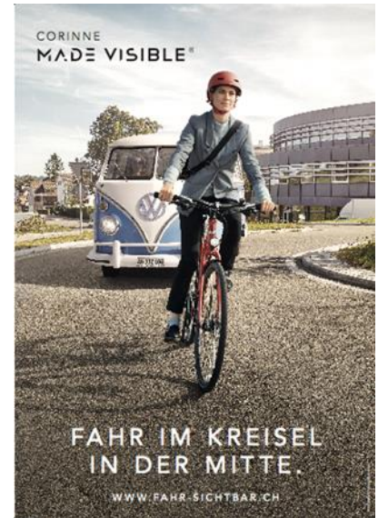
© Kampagne „Fahr sichtbar“ Pro Velo und VCS